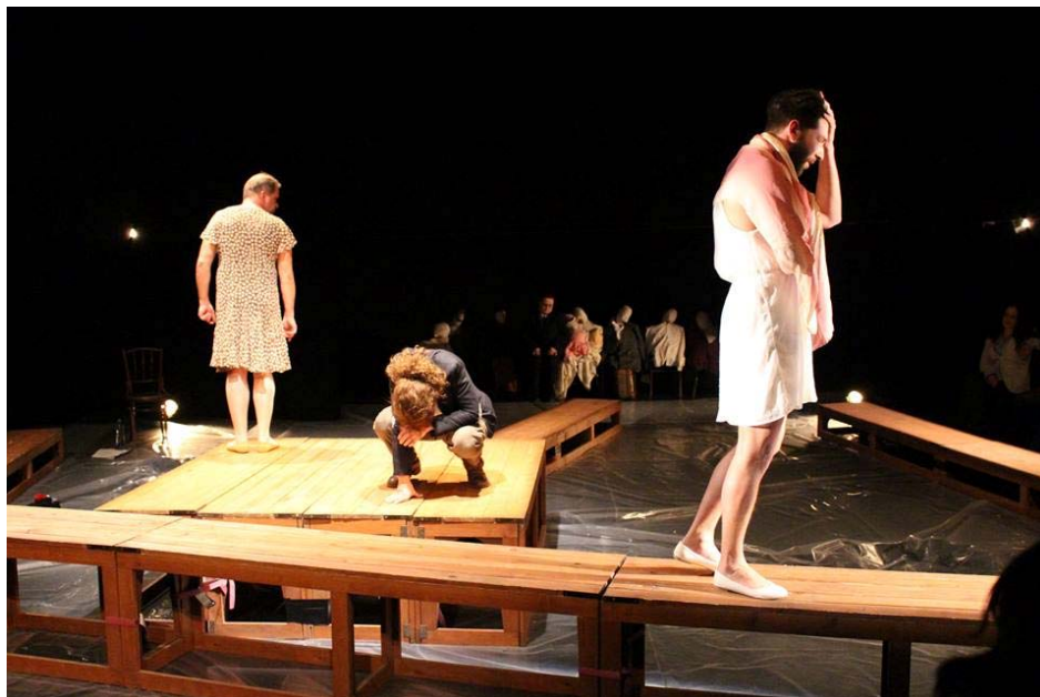
Vén Európa Hotel